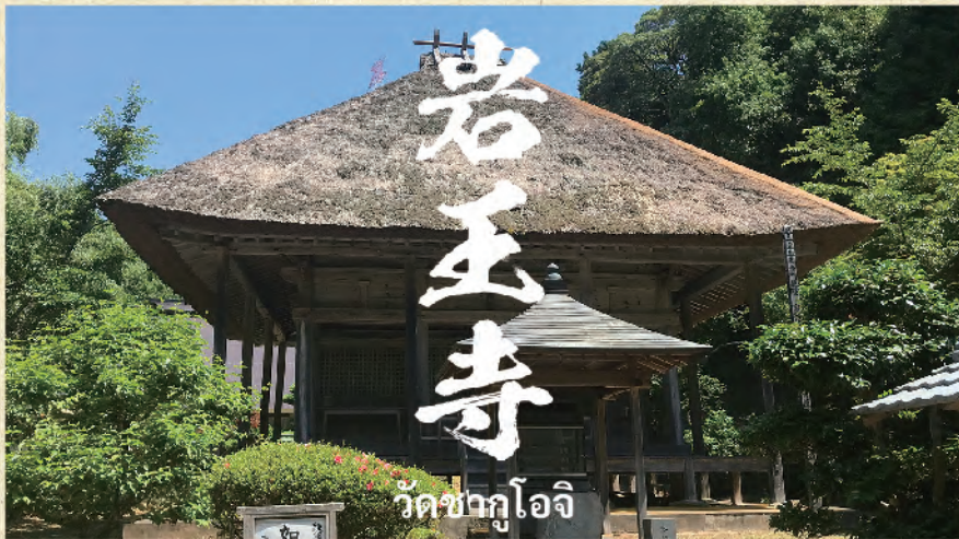
วัดซากุโอะจิ

วัดเก่าแก่ที่อยู่ลึกเข้าไปในป่าห่างไกลจากผู้คน